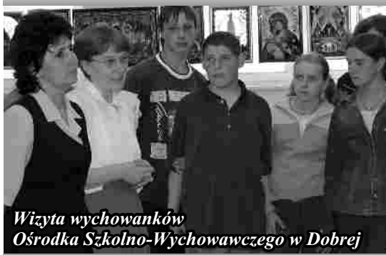
Wizyta wychowanków Ośrodka Szkolno-Wychowawczego w Dobrej